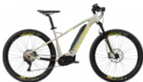
Uproc2 4.10 zandbeige/citroengeel/ijsgroen