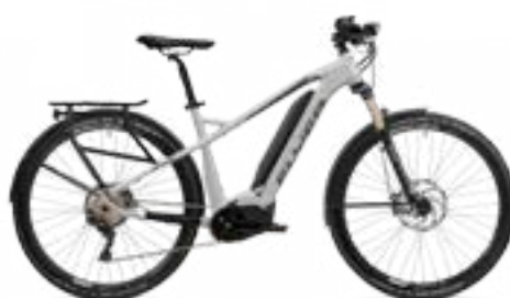
Uproc2 4.15 castsilver/zwart