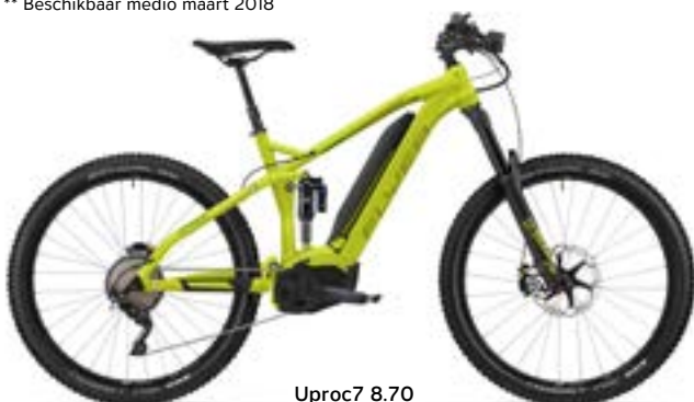
Uproc7 8.70 limegroen/naaldgroen/olijfgroen