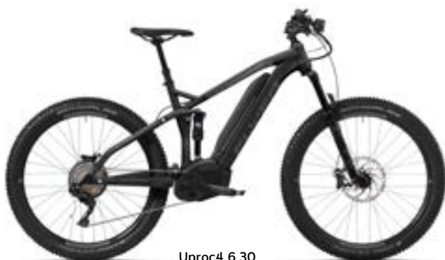
Uproc4 6.30 zwart/grafietgrijs