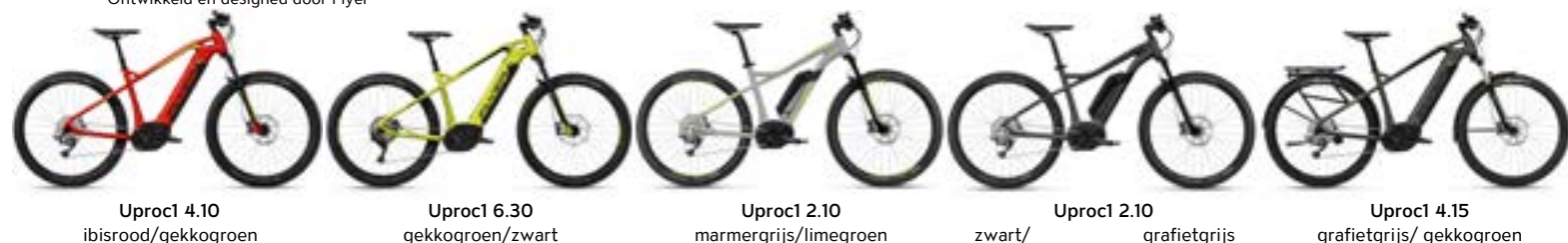
Uproc1 4.10 ibisrood/gekkogroen