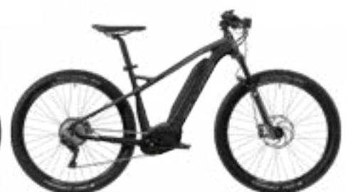
Uproc2 4.10 zwart/grafietgrijs