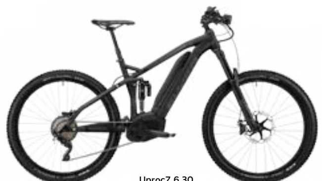
Uproc7 6.30 zwart/grafietgrijs