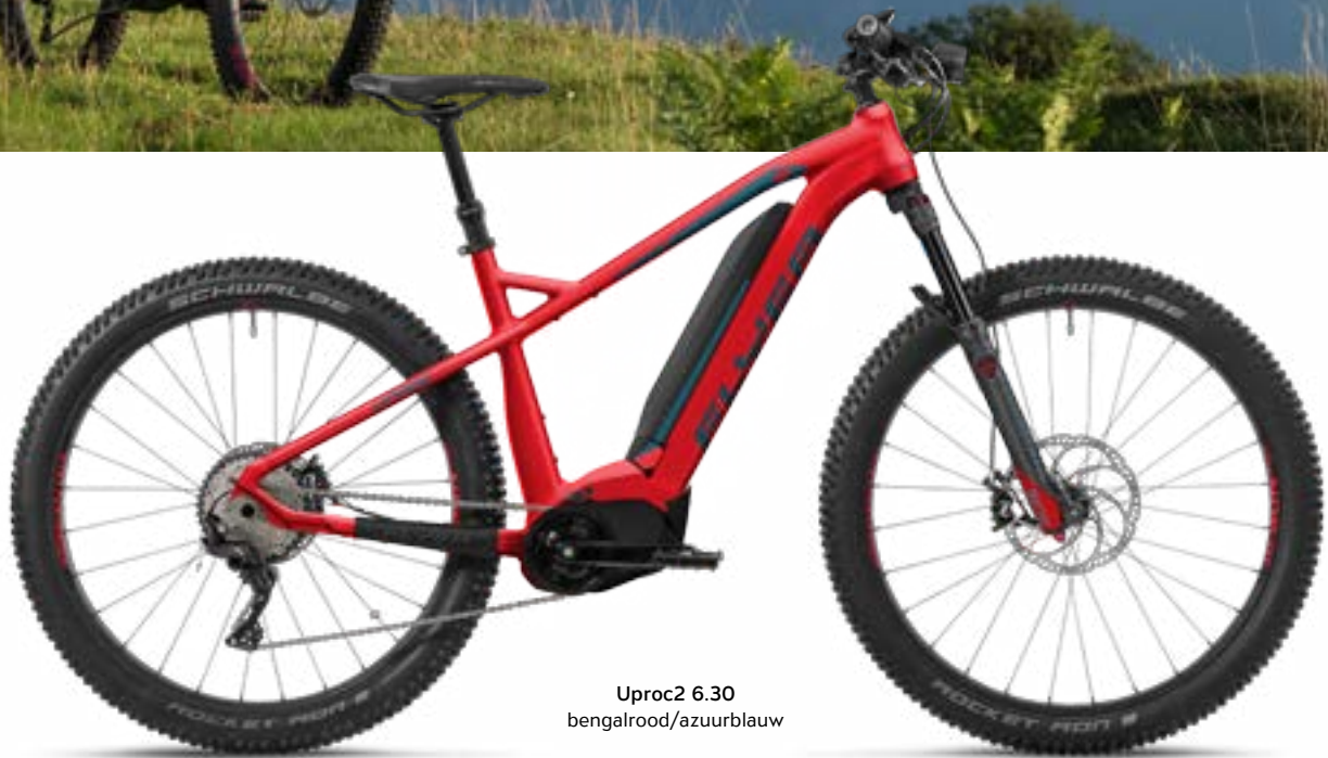
Uproc2 6.30 bengalrood/azuurblauw