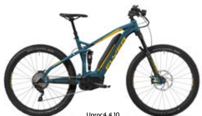
Uproc4 4.10 azuurblauw/goyageel