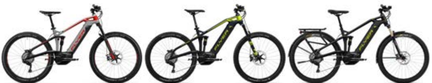
Uproc3 4.10 spacegrijs/arrasrood