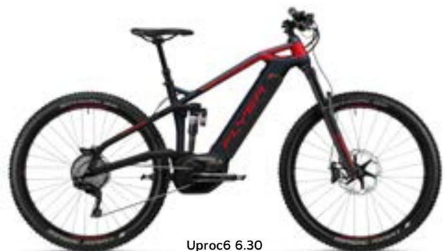
Uproc6 6.30 spaceblauw metallic/ibisrood