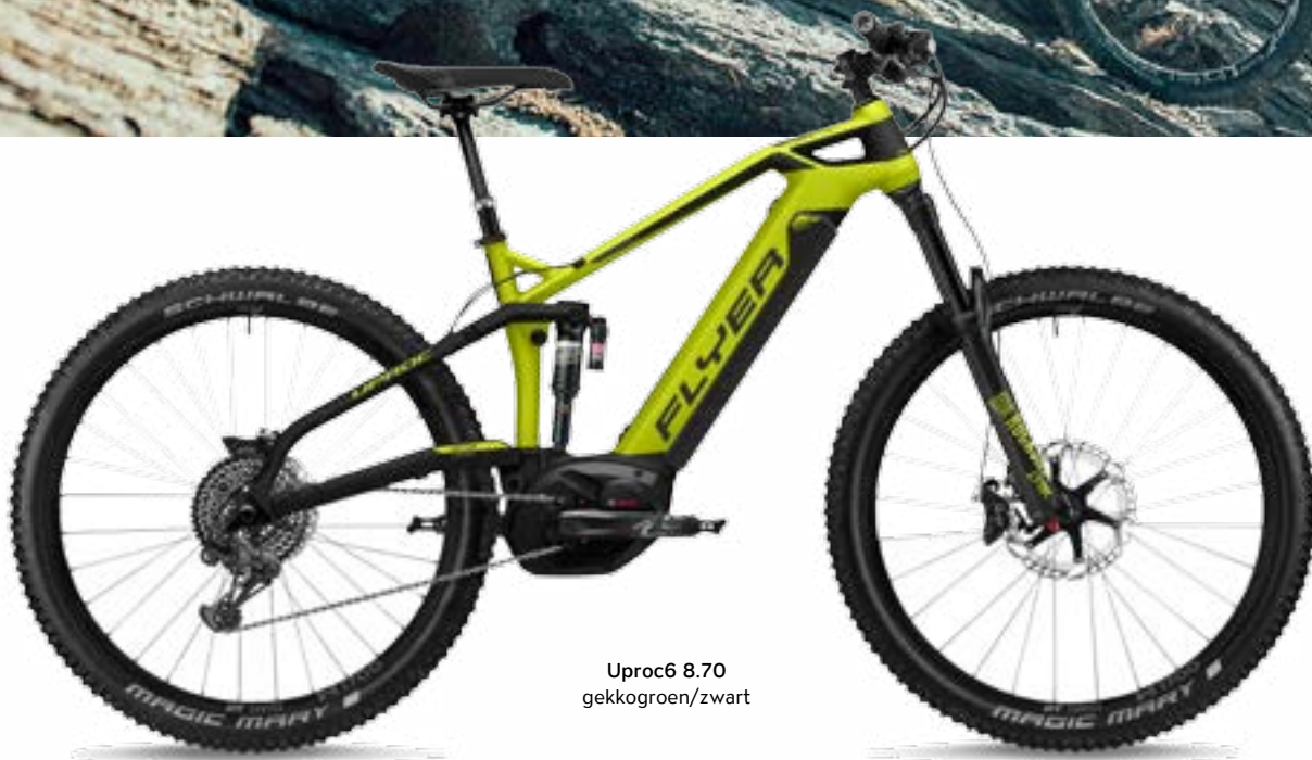
Uproc6 8.70 gekkogroen/zwart