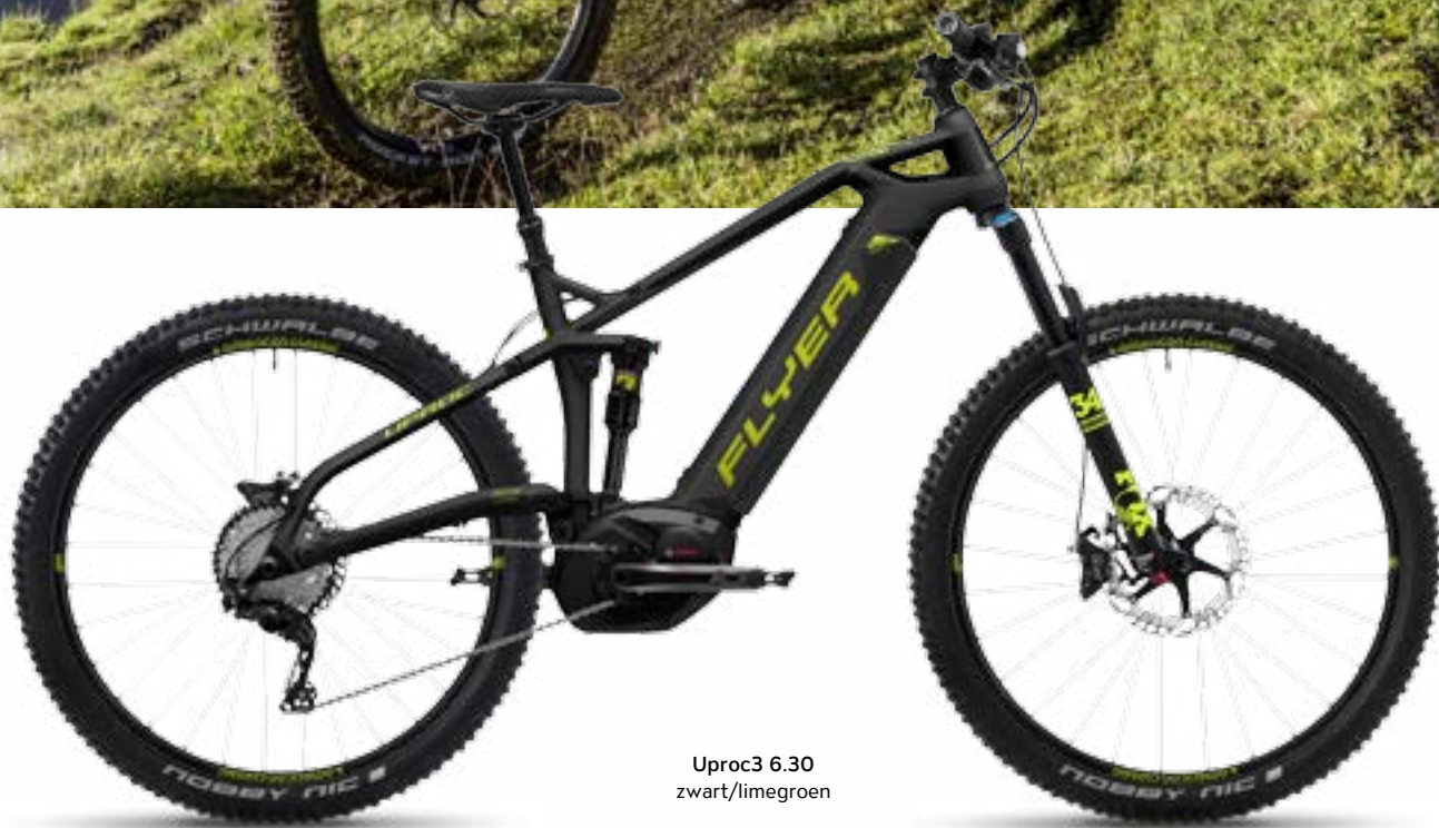
Uproc3 6.30 zwart/limegroen