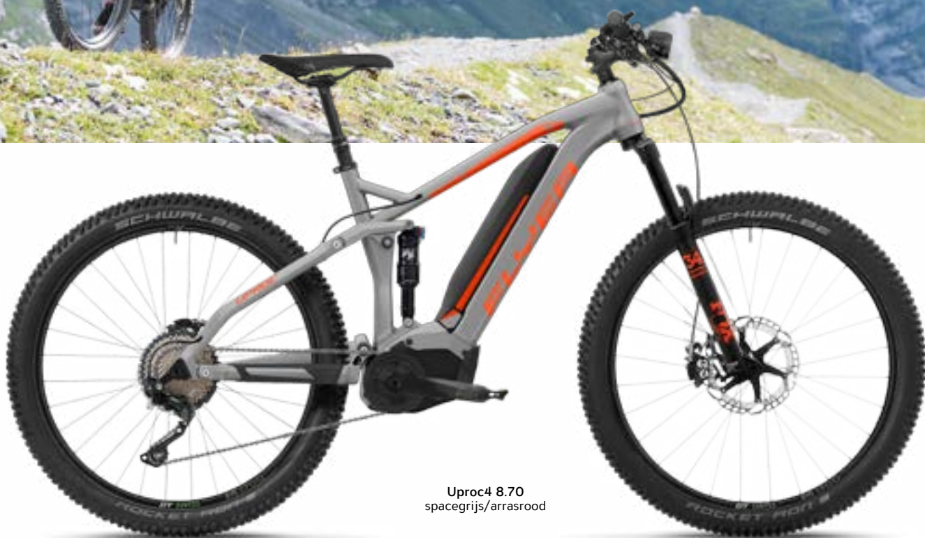
Uproc4 8.70 spacegrijs/arrasrood