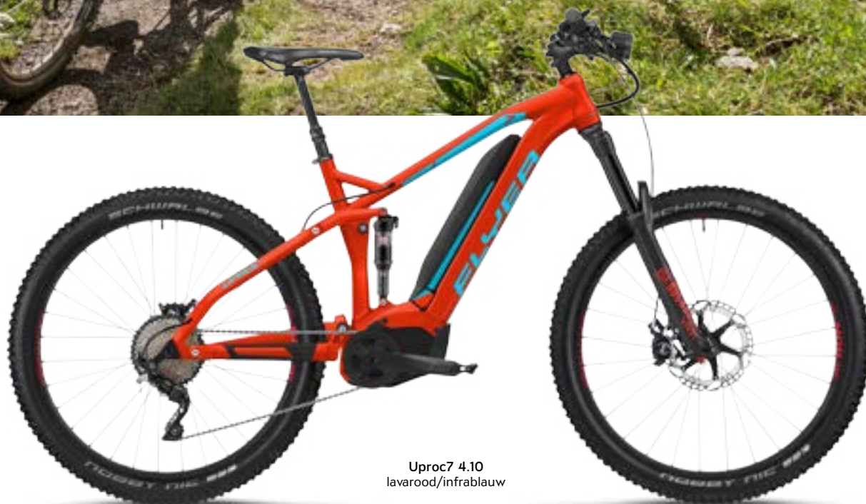
Uproc7 4.10 lavarood/infrablauw