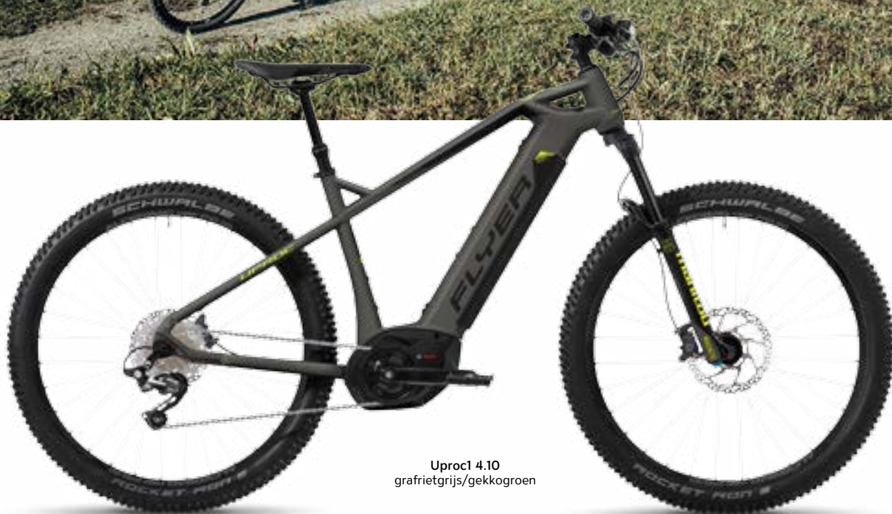
Uprocl 4.10 grafrietgrijs/gekkogroen