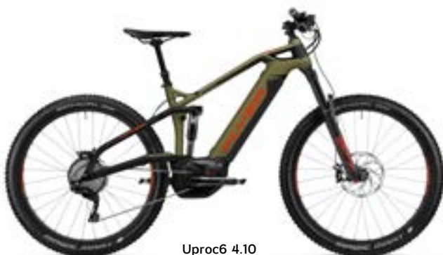
Uproc6 4.10 olijf metallic/magmarood